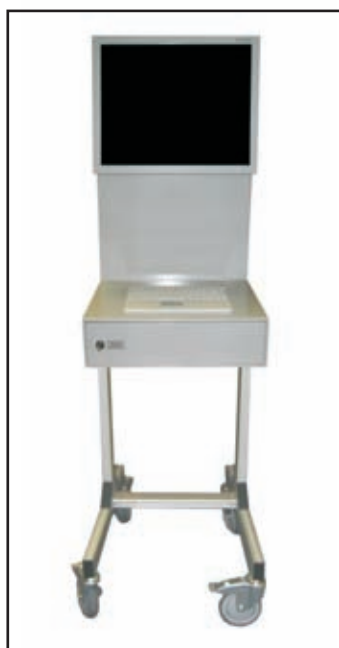
FixMode avec le TFT-Saver en système mobile