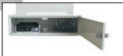
l'ordinateur est facilement accessible