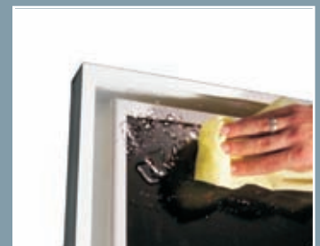
Panneau avant imperméable à l'eau