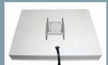
Arrière avec un crochet mural et une sortie de câble