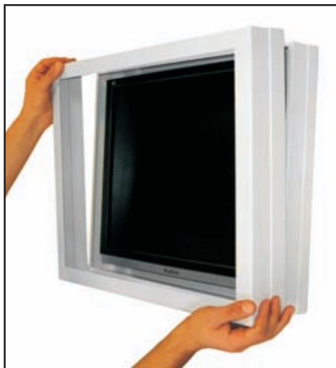
Facile à monter